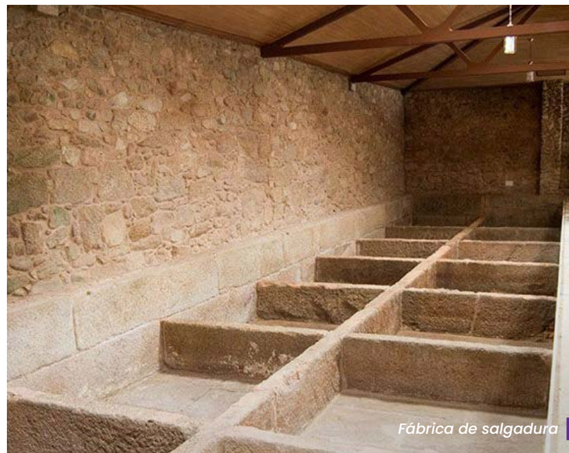
Fábrica de salgadura